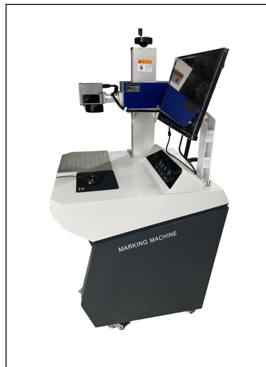
长 650 * 宽 1000 * 高 1420 mm 重量： 75KG